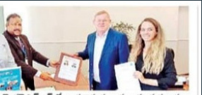
ரஷ்ய விவியாசனம் ஓர் உயர் கல்வி நிறுவனம்

சென்னை, மே 14: ரஷ்யா விஷுவல் யூர்ல் பெடர்ல் பல்கலைக்கழகம், இந்தியாவின் பாரத் உயர் கல்வி மற்றும் ஆராய்ச்சி நிறுவனம் இணைந்து, கருத்து மாதம் புரிந்துணர்வு ஒப்பந்தத்தில் கையெழுத்திட்டனர். துணை ரெக்டர் ரஷ்யா பல்கலைக்கழகம், அங்கு இருந்து மாணவர்களும், ஆசிரியர்களும் இங்கு வருவது பற்றி கருத்து மாதம் புரிந்துணர்வு ஒப்பந்தத்தில் கையெழுத்திட்டனர்.